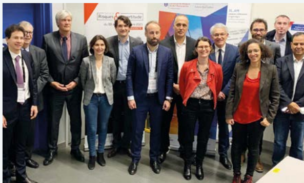
Les représentants de la ville de Mans, de MMA-Covéa et de l'Institut du Risque et de l'Assurance lors du renouvellement du partenariat.