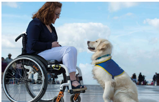
P15 La Fondation MMA Solidarité fête les 30 ans d'Handi'Chiens